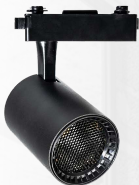
PTR 13 BL/BL