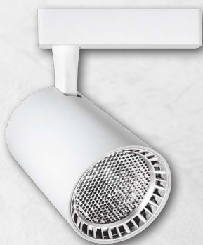
PTR 13 WH/WH