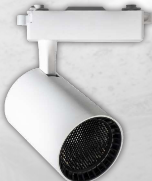
PTR 13 WH/BL